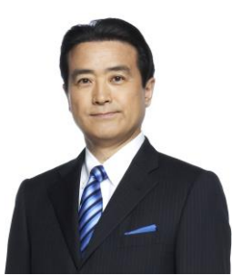
(弁士)維新の党代表 江田 けんじ