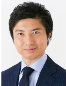
(弁士)衆議院議員 あおやぎ 陽一郎